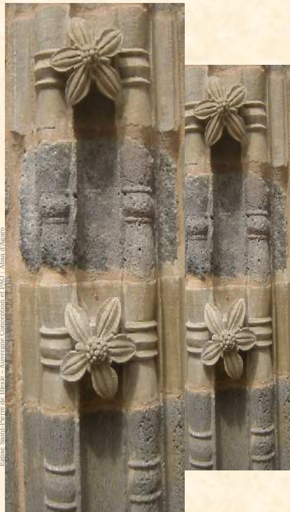
Eglise Saint-Pierre de Blesle - Auvergne Conception et PAO - Abses d'Agaro

Université de Provence Aix-Marseille I Maison Méditerranéenne des Sciences de l'Homme Salle Paul-Albert Février 5 Rue du château de l'Horloge 13100 Aix-en-Provence Organisé par le CUERMA